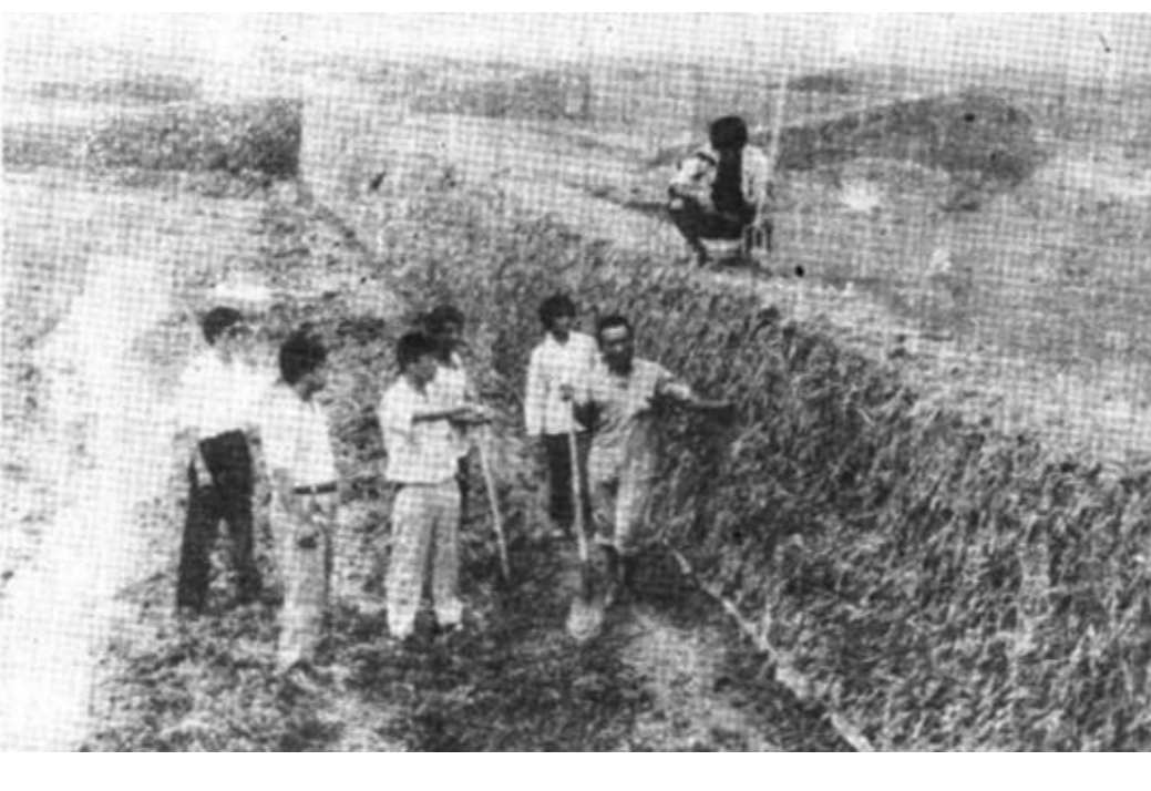
大棚一起步，当年万元户。东营区油郭乡卢家村群众响应区、乡政府大力发展蔬菜大棚生产发家致富号召，积极筹措资金25万元，发展塑料大棚50栋，现已完成土方工程。

广饶讯 广饶县工业生产实施“抓两头、促中间”战略，狠抓骨干工程建设和亏损企业扭亏工作，全县工业生产呈现高速发展的好势头，今年1—8月份全县完成工业总产值12410万元，比去年同期增长49.2%。