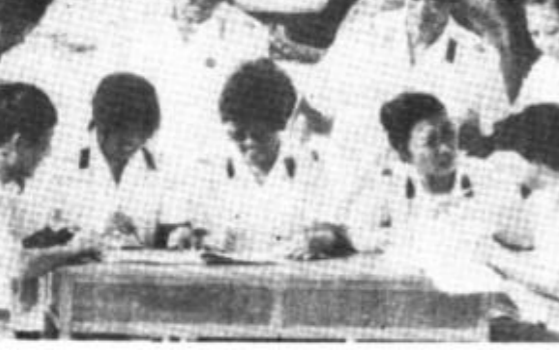
河口区交通局针对辖区内油田单位车辆多、生产任务重、车辆交费困难的情况，加大服务措施，变过去坐收收费为上门服务，极大方便了用户，深受欢迎。图为她们在油田运输三公司现场收费办公。

张大夫在医疗战线，奋斗了三十多个春秋，被她治疗过的患者不计其数。她没有追名逐利，不求富贵享受。她以自己一颗赤诚的心和对祖国医疗事业执著的追求，换取了油城人的崇高敬意。